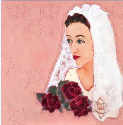
De bruid (Boulevard des déportés) (2002)